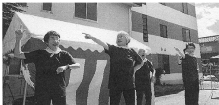
御幸支部 ジャギーダンス