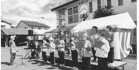
神辺支部 うたごえ