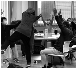
笑いヨガでほっと一息 いいぞ！いいぞ！ イエーイ

12月10日（水）合同支部長会議で、故山常務理事からあらためて大腸がん検診の基礎知識を学びました。大腸の働きに始まり大腸がんの原因や症状、検査内容・治療方法等、実際に大腸がんを発症された方のエピソードをあげてわかりやすく説明いただきました。大腸がんの便潜血検査の取り方についても「便の表面をまんべんなくこすり取ってくださいね。こすり取らずに内部に刺すだけだと出血が見逃されることがあります」と説明がありました。