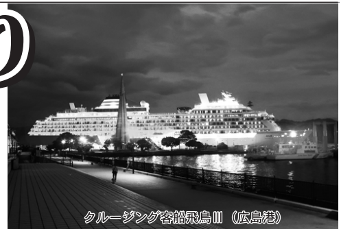
クルージング客船飛鳥III (広島港)

発行:福山医療生活協同組合 福山市木之庄町2-7-2 TEL 084-973-2280