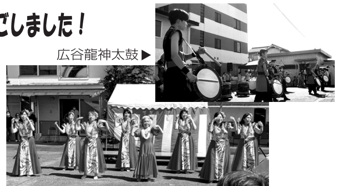
▲アロハウィークフラ