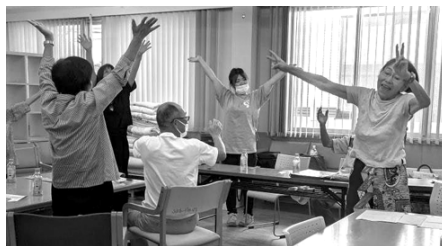
アロハ笑で「ア〜ロ〜ハ〜!!」