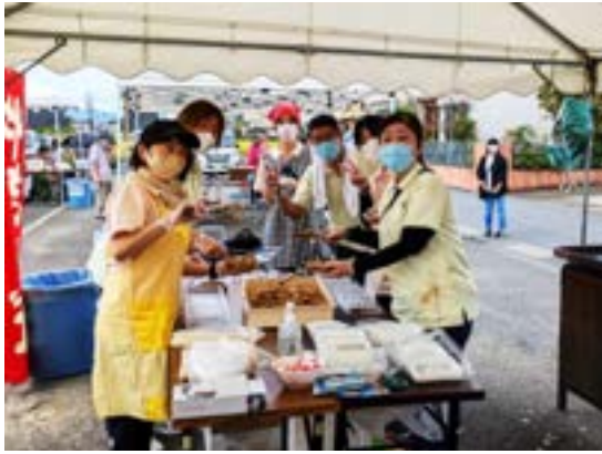
備後の里模擬店 焼きそばとお茶