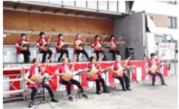
スコップ三味線 (御幸支部)