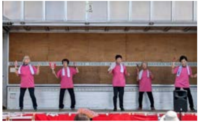
ジャギーダンス (御幸支部)