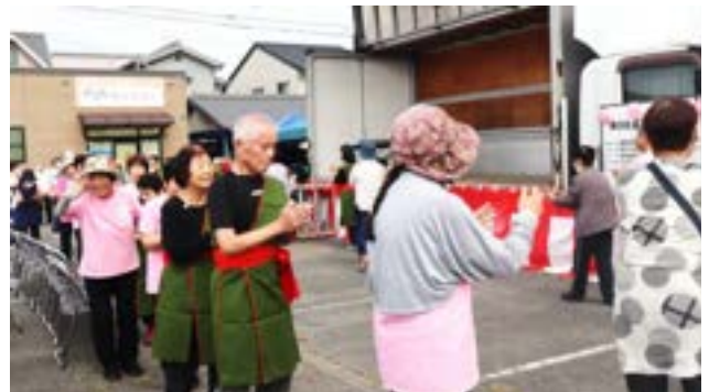
踊り 炭坑節 (あしな支部)