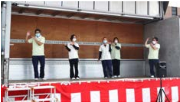
備後の里音頭 (備後の里)