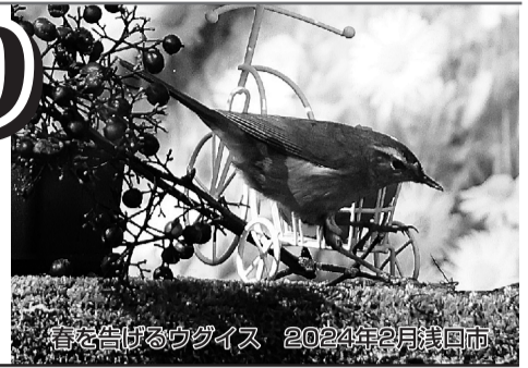
春を告げるウグイス 2024年2月浅口市