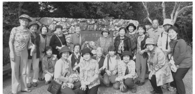
10/12(木)植物園正面玄関入口にて

10月12日(木)21名で支部旅行に行ってきました。牧野博士の「らんまん」のおかげでどこも人・人・人でおおにぎわい!