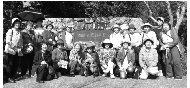
10/18(水)植物園正面玄関入口にて

10月18日(水)20名で4年ぶりの遠出の旅に行ってきました。長時間のバス旅行でしたが、行きも帰りもみんな楽しくおしゃべり・笑い声!