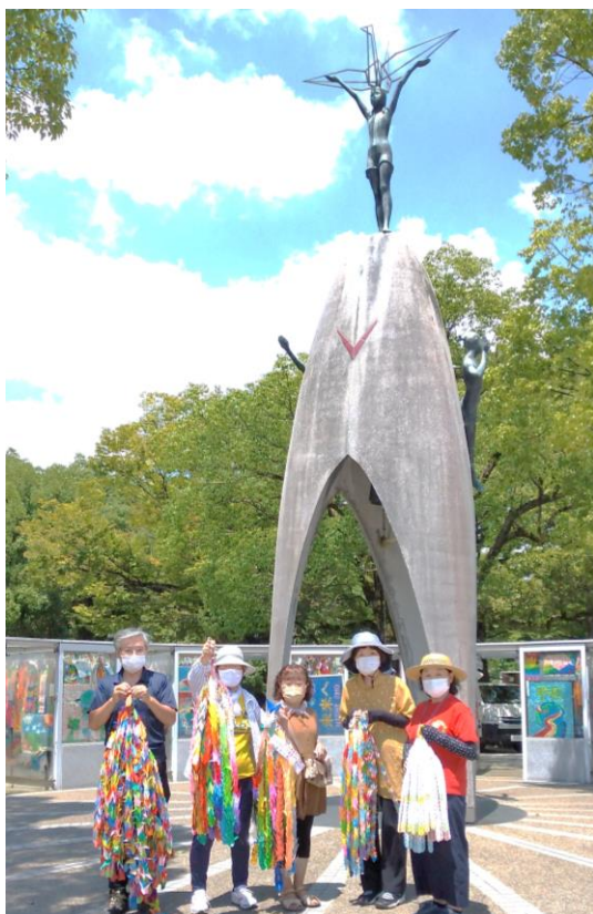
8月5日、貞子像に献納