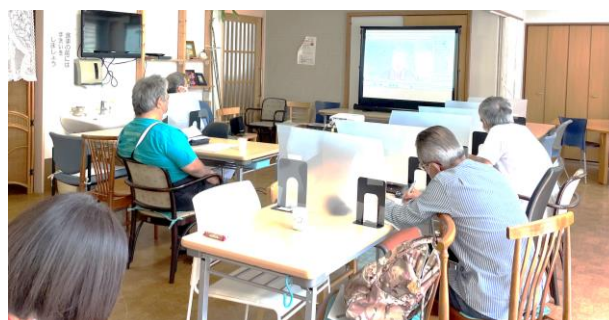
原水禁世界大会広島集会、現地企画にweb参加