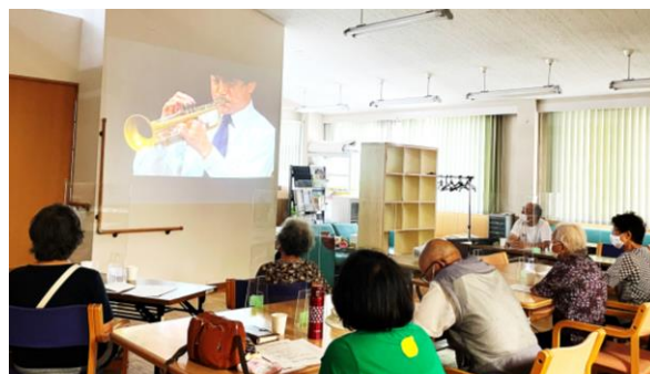
「虹のひろば」Web参加の様子