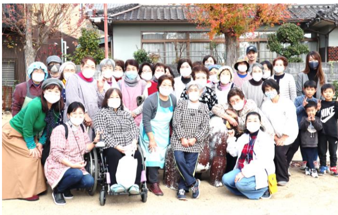
↑ プチフェスタ・4支部のボランティアさん青空市（遊休品・手作り品等）、コーヒー以外はテイクアウト。小学生までくじ引きあり →

懇談の最後に総務課長が「体育館は、災害時の避難場所という点では環境整備になる。関係部署に要望をつなぎます」と言われました。引き続き要望していきます。